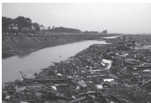
③ 藤曾根排水機場(宮城県岩沼市)。左:仮設ポンプによる排水、右:排水路に集積した瓦礫